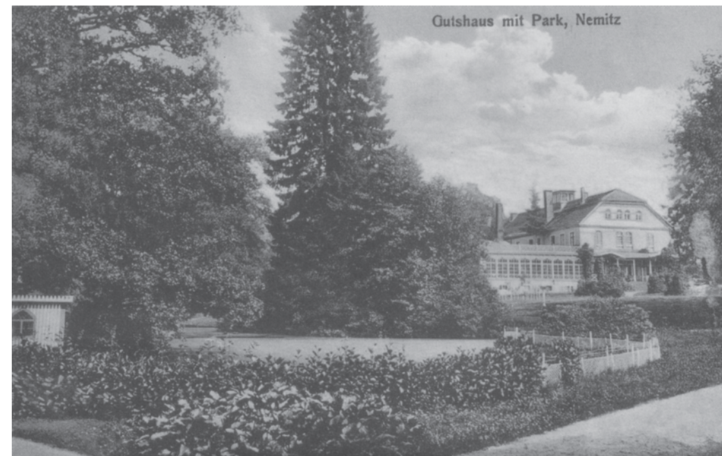
OKOŁO 1920 Pałac i park w Nemitz (obecnie Niemica).